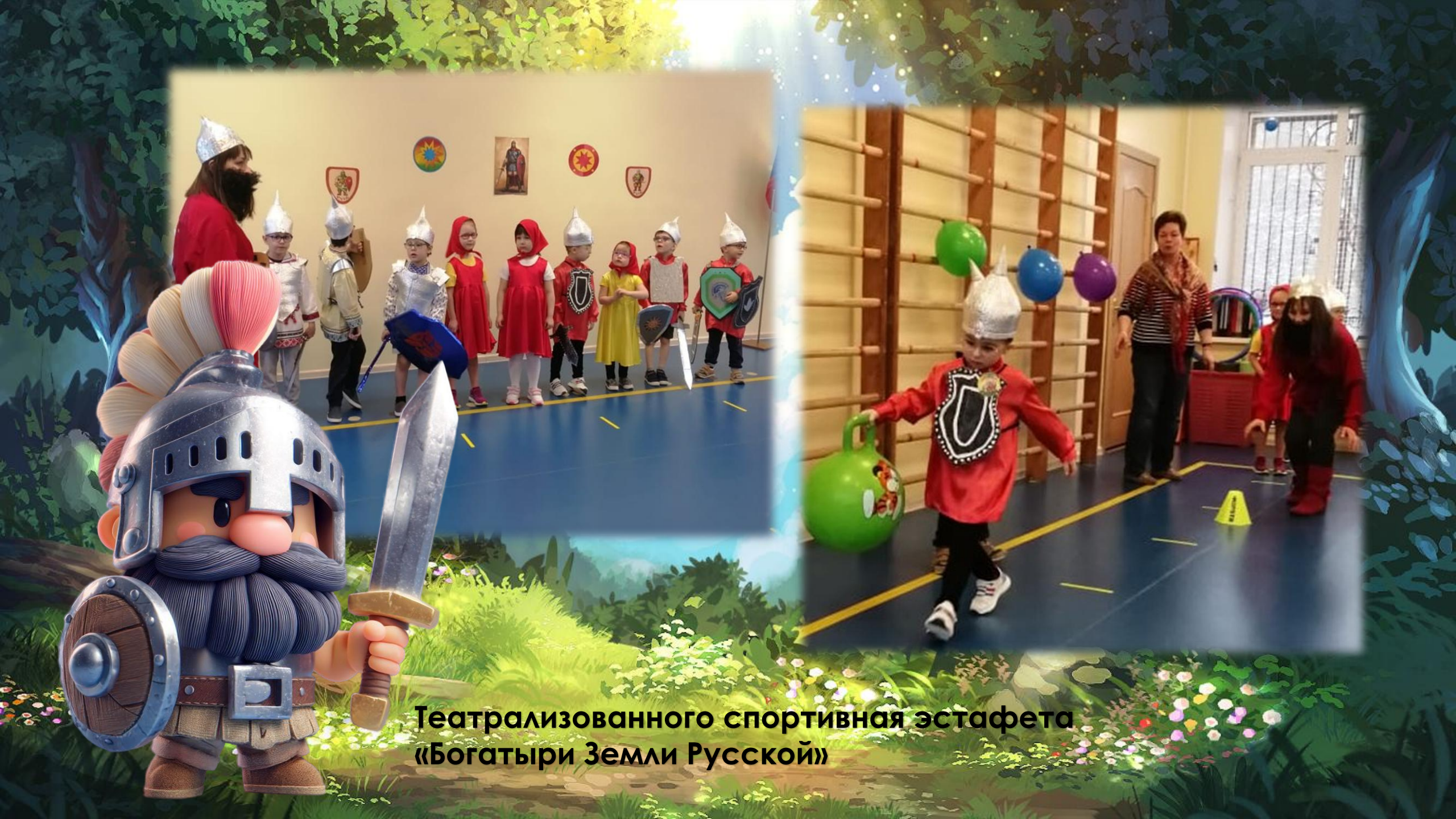
Театрализованного спортивная эстафета «Богатыри Земли Русской»